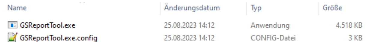
Abb.: Dateien, die mit dem GS-ReportTool ausgeliefert werden